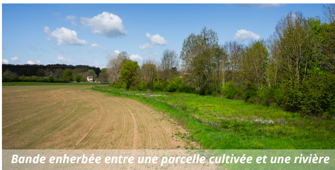
Bande enherbée entre une parcelle cultivée et une rivière