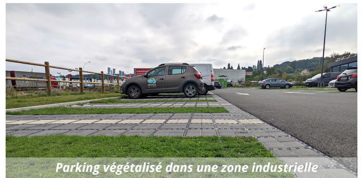
Parking végétalisé dans une zone industrielle